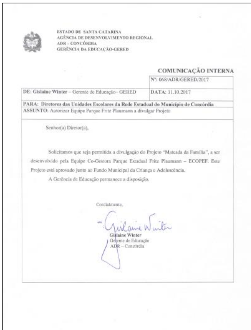
Doc 01 – Ofício GERED