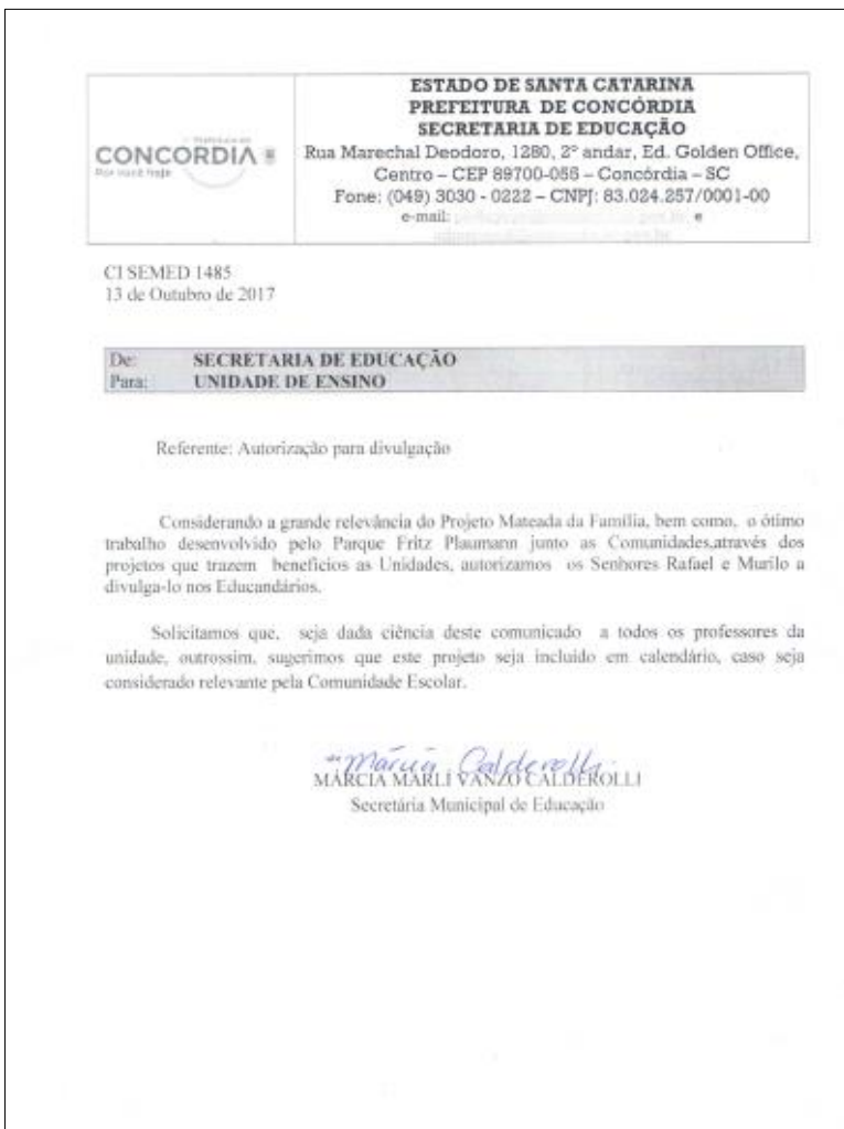
Doc 02 – Ofício SEMED