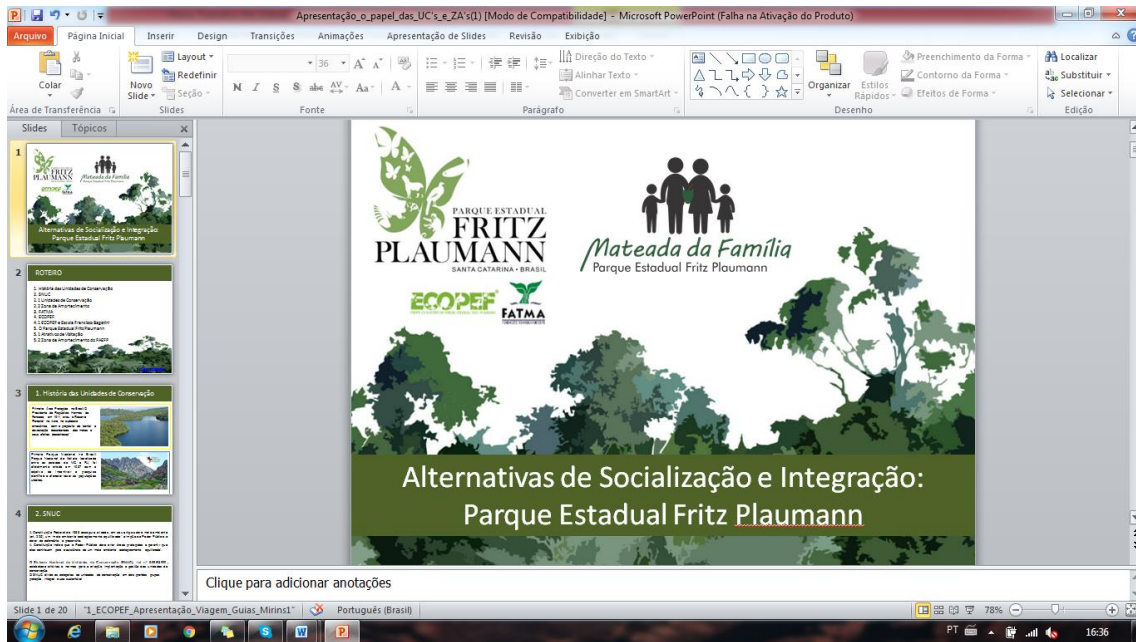
Doc 03 – Palestra a ser utilizadas nas Unidades Escolares e de Assistência